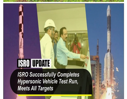
ISRO UPDATE ISRO Successfully Completes Hypersonic Vehicle Test Run, Meets All Targets